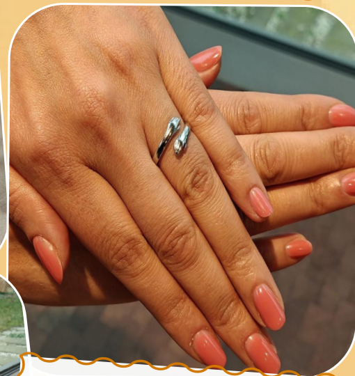
Conclusie van de vrouwen : we gaan vol vertrouwen de toekomst in - 7 februari.